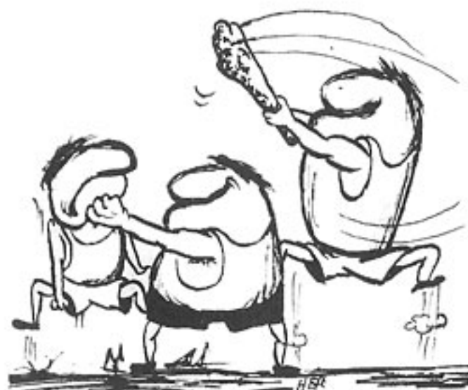
Dreikampf Altersklasse V